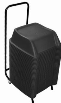
Negro Pedido mínimo 15 set