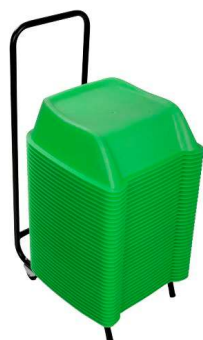
Verde Pedido mínimo 15 set