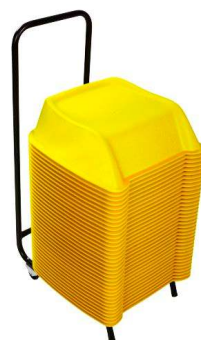
Amarillo Pedido mínimo 15 set