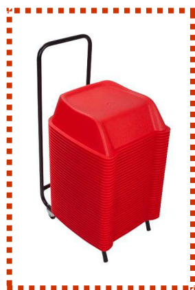
Rojo. en Stock Pedido mínimo 1 set

Y en los casos en el que se desee un color especifico de la carta universal Pantone, se podrá optar igualmente por esta opción (para pedidos de mínimo 25 set) Consulte Pazos de entrega.