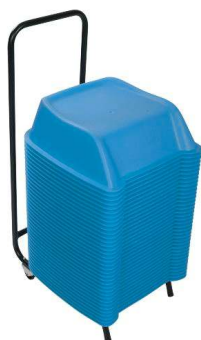
Azul Pedido mínimo 15 set